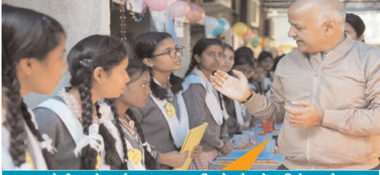
कम उम्र से ही अपने स्टार्ट-अप शुरू कर बिजनेस के कोर एलिमेंट्स को समझते हुए हमारे स्कूलों में पढ़ने वाले बच्चे स्मार्ट एंटरप्रेन्योर के साथ जिम्मेदार नागरिक भी बन रहे हैं: मनीष सिसोदिया, उपमुख्यमंत्री व शिक्षा मंत्री

नई दिल्ली, 12 दिसम्बर (देशबन्धु)। दिल्ली सरकार के स्कूलों में पढ़ने वाले बच्चों को जाँब सीकर बनने के बजाय जाँब प्रोवाइडर बनाने के उद्देश्य से शुरू किए गए बिजनेस ब्लास्टर्स प्रोग्राम ने अपने पहले साल में शानदार उपलब्धियाँ हासिल कीं। इसके दूसरे साल में भी केजरीवाल सरकार के स्कूलों के बच्चे अपने शानदार बिजनेस आइडियाज के दम पर बॉर्डिंग एंटरप्रेन्योर बनने की शुरुआत कर चुके हैं। बिजनेस ब्लास्टर्स कार्यक्रम के क्रियान्वयन के साथ-साथ बच्चों के शानदार बिजनेस आइडियाज को जानने के लिए सोमवार को उपमुख्यमंत्री व शिक्षा मंत्री मनीष सिसोदिया ने सर्वोदय कन्या विद्यालय मंडावली नंबर एक का दौरा किया और छात्रों से उनके बिजनेस आइडियाज के बारे में चर्चा की। इस मौके पर श्री सिसोदिया ने कहा कि कम उम्र से ही अपने स्टार्ट-अप शुरू कर बिजनेस के कोर एलिमेंट्स को समझते हुए हमारे स्कूलों में पढ़ने वाले बच्चे स्मार्ट एंटरप्रेन्योर के साथ जिम्मेदार नागरिक भी बन रहे हैं। मुझे यह देख कर खुशी कि हमारे